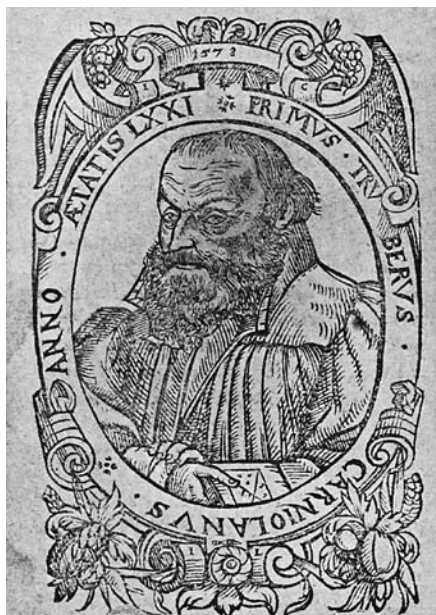
Primož Trubar (1508.–1586.)

ke ( locos theologicos ), oba sta naslovljena na kralja Maksimilijana. V prvem predgovoru sem opisal in orisal Turke in kristjane, ki bivajo v Srbiji, Bolgariji, Bosni, na Hrvaškem, v Dalmaciji, na Kranjskem, Spodnještajerskem, Koroškem, na Krasi in v Istri, njihove navade, lastnosti, običaje, obrede, izročila, vero, praznoverje (tudi romarsko pot pri Gornjem Gradu sem opisal), nadalje njihov strah, stisko in nesreče, ki jim jih povzročajo Turki itd. Iz tega bodo vsi Nemci spoznali, kako zelo potrebujejo ta ljudstva naše prevajanje in tisk. V drugem predgovoru obračunavam staro in novo vero. Iz tega bodo vsaj malo spoznali, da je naša vera prava stara vera, in da je papeška in turška kriva in nova. Ta predgovor sem napisal tudi v slovenščini za augsburško veroizpoved, ki jo nameravam tiskati v 14 dneh v Tübingenu, čim bodo latinske črke prenovljene, ker so izrabljene, stare, da z njimi ni mogoče čitljivo tiskati (Rajhman, 1986: 104).