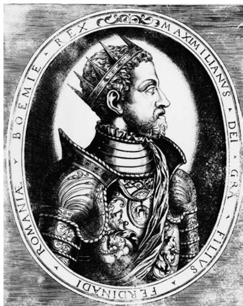
Kralj Maksimilijan II.