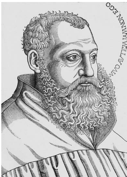
Petar Pavao Vergerije ml. (1489.–1565.)