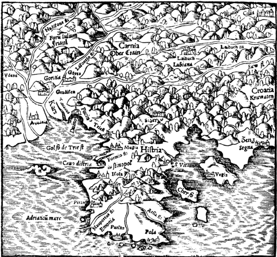
Istra; karta u knjizi: Sebastian Münster, Cosmographia Universale , Basel, 1550.