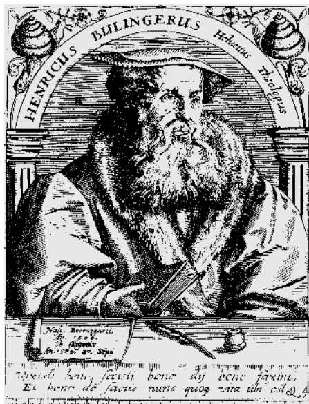
Heinrich Bullinger (1504.–1574.)